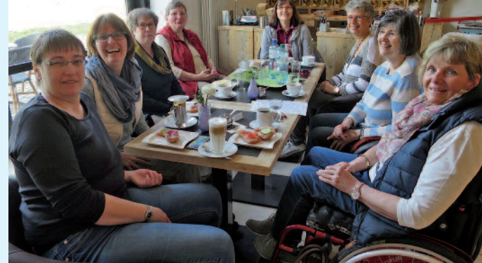
Kontaktkreise bieten Möglichkeiten zum Erfahrungsaustausch.

Vorrangig werden folgende Themen behandelt: Krankheitsbewältigung; Arbeit und Beruf, Wohnen; medizinische Versorgung, Hilfsmittelversorgung, Schwerbehindertenausweis; Partnerschaft, Familie, Sexualität, Kinderwunsch; finanzielle Unterstützung und weitere Hilfen.