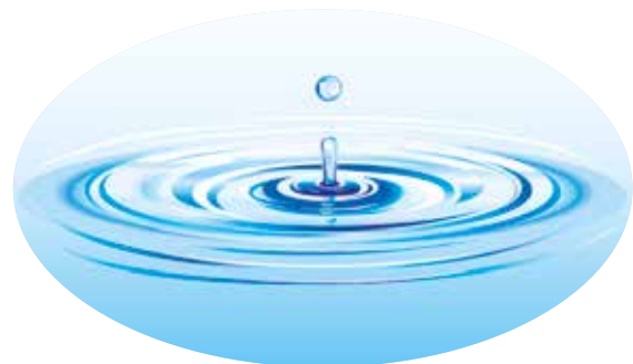
Bild: AllVectors • http://www.allvectors.com License: Creative Commons Attribution-Share Alike 3.0 Unported License See this page for more information about licens http://creativecommons.org/licenses/by-sa/3.0/

Das Wasser der Erde ist ständig in Bewegung, zirkuliert in der Atmosphäre und in den Meeresströmungen, türmt sich zu Wellen und rauscht die Flüsse hinunter. Museumsbesucher schlüpfen in die Rolle eines Tropfens auf dem langen Weg durch den Wasserkreislauf und lernen, wie man an den Wolken das Wetter erkennt.