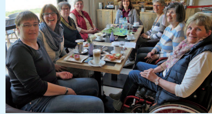
Kontaktkreise bieten Möglichkeiten zum Erfahrungsaustausch.

Vorrangig werden folgende Themen behandelt: Krankheitsbewältigung; Arbeit und Beruf, Wohnen; medizinische Versorgung, Hilfsmittelversorgung, Schwerbehindertenausweis; Partnerschaft, Familie, Sexualität, Kinderwunsch; finanzielle Unterstützung und weitere Hilfen.